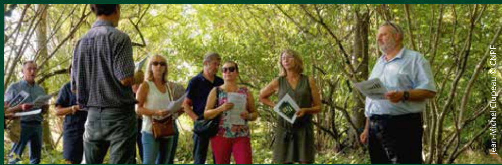
Jean-Michel Clupeau © CNPF

E n collaboration avec les autres organismes de la filière forêt-bois, le CRPF a mis en place et assure le suivi d'un réseau de parcelles forestières de référence.