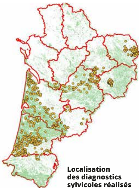
Localisation des diagnostics sylvicoles réalisés