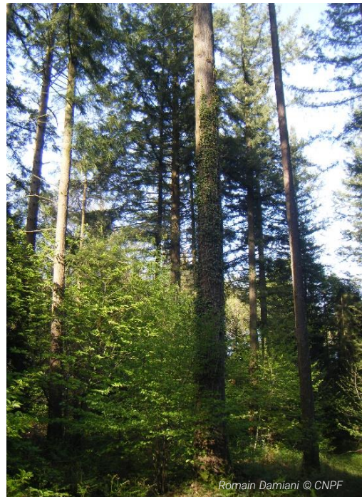
Peuplement traité en couvert continu