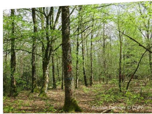
Arbre d'avenir repéré à la peinture