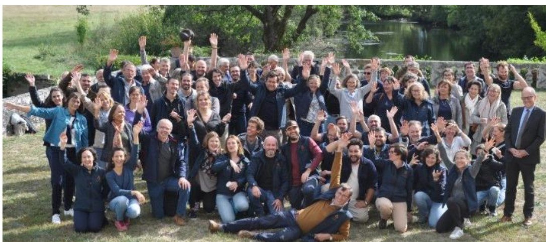
Réunion du personnel 2022