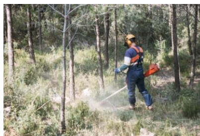
Louis-Michel DUHEN © CNPF