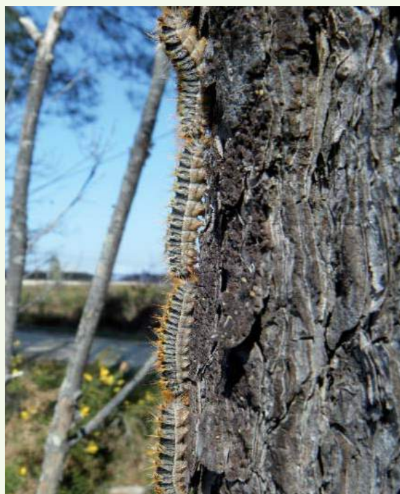
Chenilles processionnaires

jeunes et ceux dont la survie est menacée) ou de limiter les risques d'urtications dont les conséquences sanitaires peuvent être graves pour l'homme et certains animaux. Elle consiste, le plus souvent, à réaliser un traitement par voie terrestre ou aérienne 2 sur les premiers stades larvaires à l'aide d'un insecticide homologué, notamment par lutte biologique à base de Bacillus thuringiensis .