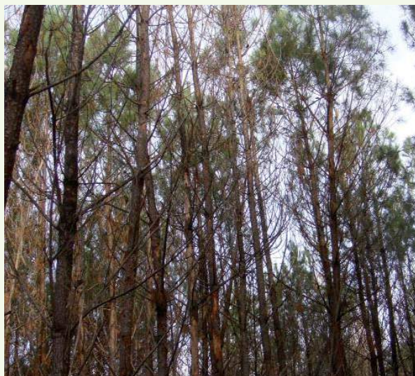
Peuplement sinistré avec dégâts de scolytes

Après 2009, il s'attendait à ce que les scolytes attaquent les chablis. En conséquence, il a fait exploiter ses gros bois le plus rapidement possible mais, faute d'acheteur, il s'est retrouvé devant l'impossibilité absolue d'exploiter les bois moyens. « Ces bois sont restés sur place jusqu'à l'hiver 2010. Cette année-là a vu une attaque de très grande ampleur. Il y avait de la matière par terre puis les insectes se sont attaqués aux arbres sains ». Sur ses propriétés de Luglon et Vert, tous les peuplements d'âge moyen, abîmés à plus de 70 % par la tempête et non exploités, ont été « scolytés ». « Un peuplement plus jeune, entouré de chablis exploités dès l'été 2009 a été épargné. Il semble que les vents dominants ont influencé la progression des insectes. Mais il est sûr que l'on a aussi transporté des scolytes avec le bois et que l'on a contribué à infester des peuplements qui s'en seraient sortis autrement ». M. Boyau a aussi fait l'expérience de pins de 40 ans épargnés par la tempête et attaqués par l'ips 5 en 2010. A l'automne, il a fait exploiter les tâches attaquées en maintenant le peuplement restant qui lui semblait viable. Cette décision a permis de limiter les pertes sur la valeur des bois. Il y avait un risque car sa parcelle est entourée de peuplements touchés non encore exploités, mais en 2011 les attaques n'ont pas progressé.