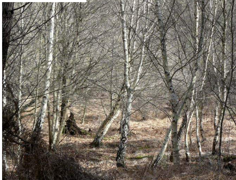
Bouleaux en îlot (CRPF Aquitaine)

A l'échelle du massif, l'objectif à privilégier est le maintien ou le renforcement des boisements de feuillus pour la constitution de réserves de faune auxiliaire. Des études menées sur le massif aquitain ont en effet montré que les bois de feuillus sont particulièrement riches en espèces d'oiseaux, d'insectes et d'araignées capables de réguler les populations d'insectes herbivores grâce à leur activité prédatrice. Par exemple, les bosquets feuillus sont des milieux refuges pour les oiseaux insectivores, consommateurs de chenilles processionnaires (huppe fasciée, mésange charbonnière). Ils accueillent aussi des prédateurs d'insectes ravageurs (parasites de la pyrale du tronc).