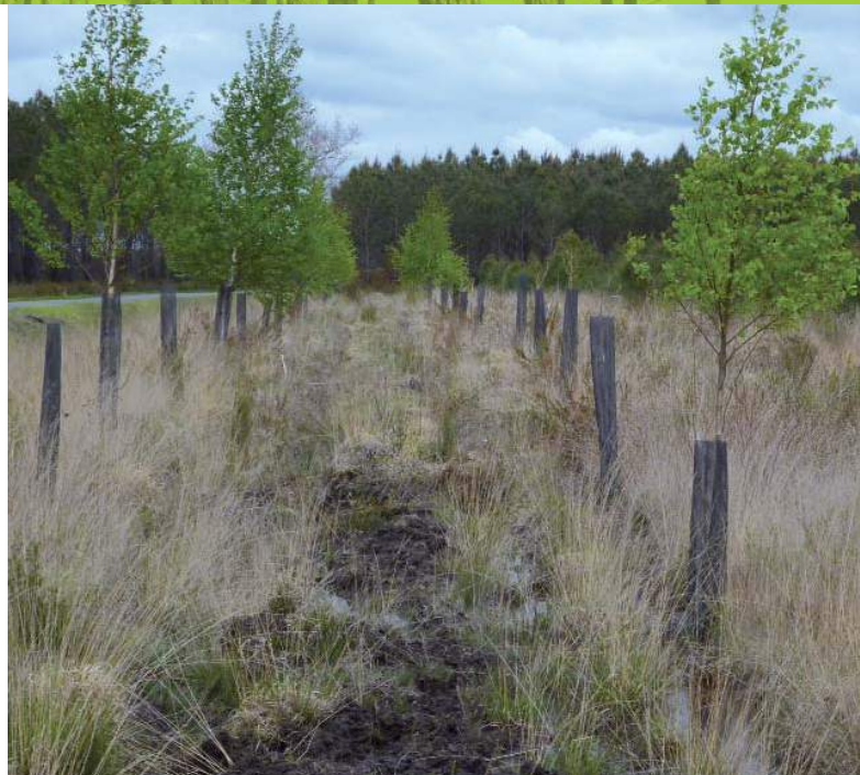
Création d'une lisière feuillue

La création de formations feuillues se fait par plantation en plein ou en enrichissement. Cependant ces coûteuses installations dans les milieux difficiles de la lande présentent des risques élevés de mauvaise reprise et donc souvent de mortalité. La plantation doit être accompagnée par un travail du sol et dans la plupart des cas par l'ajout d'une protection individuelle contre les cervidés. Les essences locales doivent être privilégiées, notamment dans la perspective de la protection sanitaire