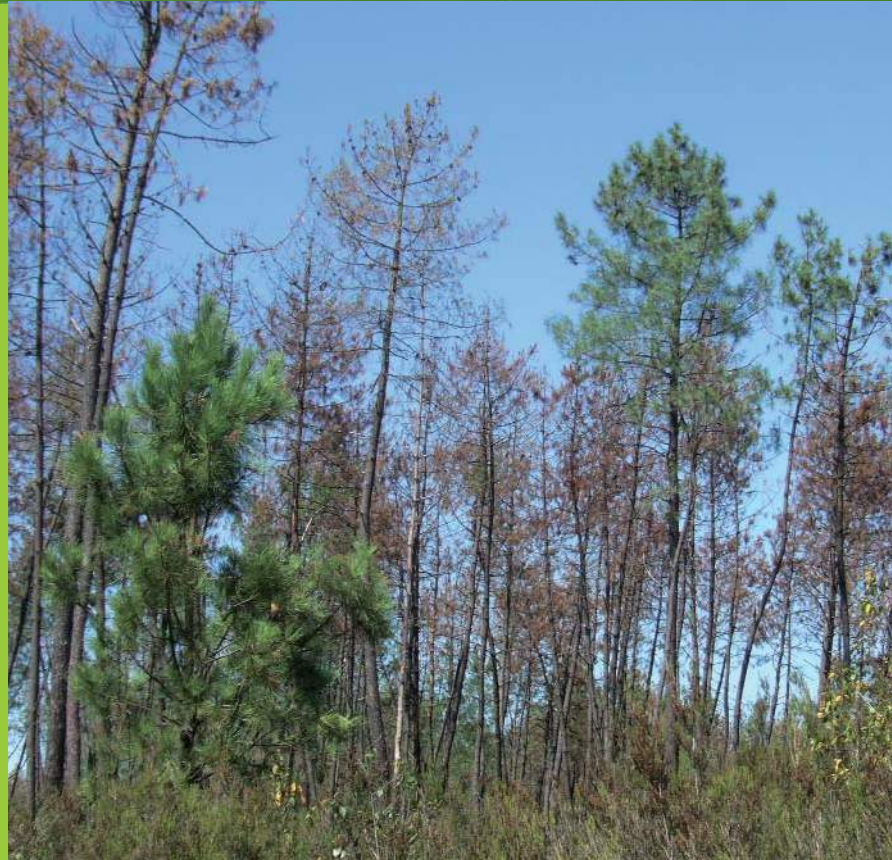
Dégâts de scolytes

La tempête Klaus a provoqué d'importantes perturbations de l'écosystème forestier. Ceci a conduit à des problèmes sanitaires multiples, certes attendus, mais dont l'ampleur est inégale. L'introduction de plus de diversité, notamment par les feuillus, apparaît comme étant une voie possible d'un meilleur état sanitaire.