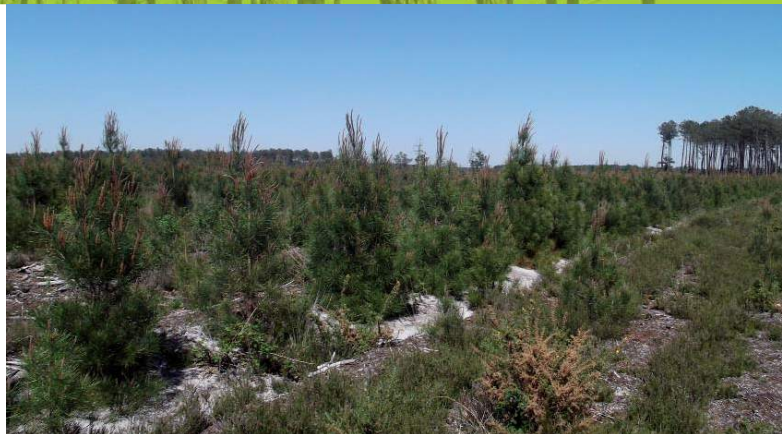
Jeune plantation de pin maritime

Dans « le triangle de la pathologie » arbres-environnement-parasites, le forestier ne peut agir préventivement qu'en pratiquant une sylviculture innovante adaptée au changement global. Cela se traduit par une conduite dynamique des peuplements afin de réduire notamment la compétition et les risques liés à la sécheresse. Par une diversification des peuplements, et