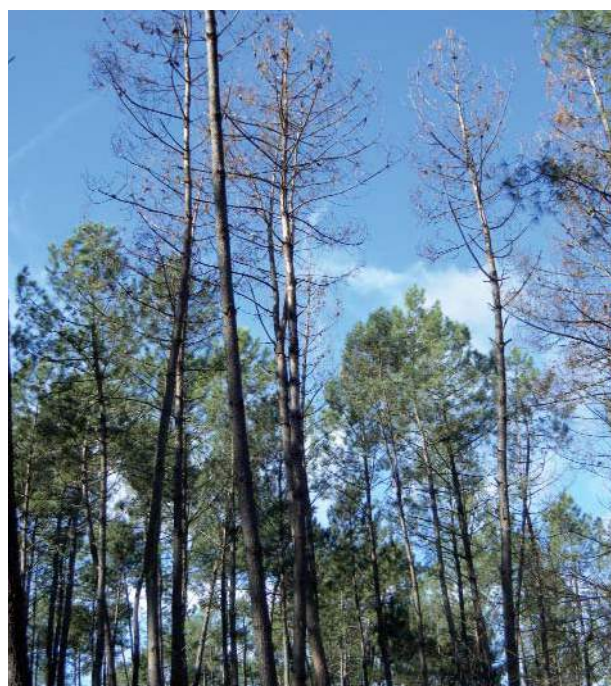
Dégâts de scolytes

A moyen terme, la prévention des attaques de scolytes dans les plantations de pin maritime passe par un renforcement de la vigueur individuelle des arbres. De nombreux travaux de recherche, menés notamment en Amérique du Nord, montrent clairement qu'un régime d'éclaircies régulières visant à renforcer la croissance radiale permet de maintenir un niveau élevé de résistance aux attaques de scolytes, via la production de résine toxique.