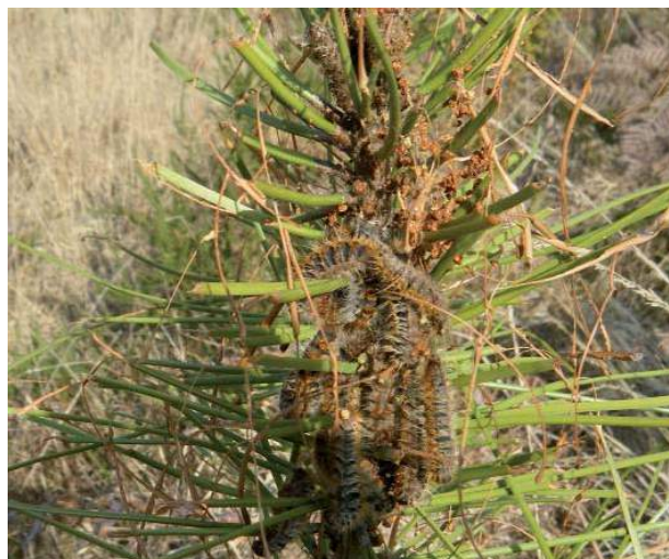
Dégâts de chenilles processionnaires

A court terme, après qu'une tempête ou un autre accident climatique (sécheresse, gel) ont brusquement augmenté le volume de bois favorable au développement des populations de scolytes, il convient de tout mettre en œuvre pour réduire au plus vite, dans l'idéal en quelques mois, ce substrat de reproduction. L'analyse des pullulations de scolytes typographes en Europe du Nord et sténographes en Aquitaine montre une corrélation très nette entre volume de chablis et pourcentage d'arbres scolytés, à l'échelle de la petite région forestière. Les mêmes études confirment l'efficacité de la récolte de chablis et bois récemment scolytés pour limiter les nouvelles attaques, avec un meilleur rendement dans les zones les plus touchées. Ces résultats suggèrent de concentrer les premières interventions de nettoyage dans les parties les plus impactées des massifs forestiers.