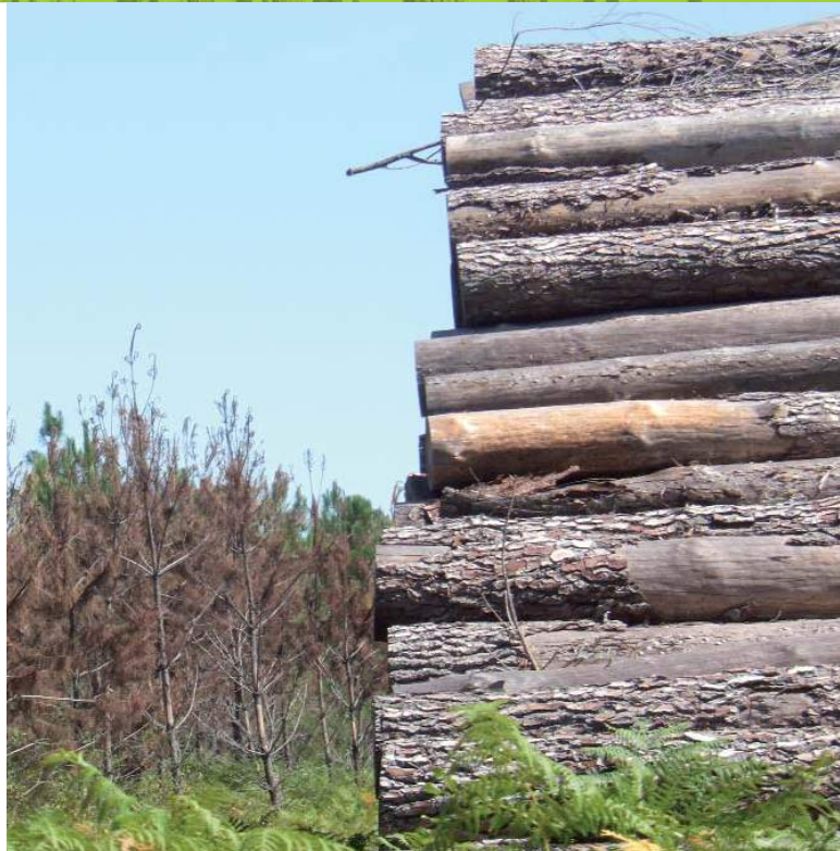
Pile de bois en bordure de parcelle et dégâts de scolytes

Après le répit hivernal, le traitement 2011 a été avancé au 15 mars par mesure de précaution. Il a été décidé qu'il serait systématique, ce qui a conduit à traiter près de 2 millions de stères bord de route (jusqu'en octobre 2011).