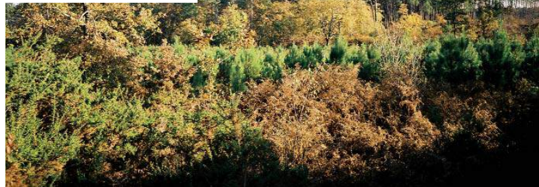
Peuplement diversifié

Le paysage du massif landais est souvent perçu sous l'angle de son homogénéité [voir encadré] : dominance des peuplements forestiers de pin maritime. Or, entre les pins, une approche fine permet de constater que les boisements feuillus tiennent une certaine place dans le paysage forestier. Il peut s'agir de formations linéaires plus ou moins larges : galeries forestières le long des rivières et cours d'eau mêlant aulnaies, chênaies à chêne pédonculé ou chêne tauzin en fonction du rabattement de la nappe induite par l'encaissement de la vallée, lisières de chênes ou de bouleau bordant les pinèdes en limite de propriété ( barradeaux, dougues ), le long des routes, des crastes ou des fossés. On recense aussi des taches de feuillus formants des bosquets plus ou moins denses et étendus. Ils peuvent avoir des origines anciennes (airiaux, parcs à moutons, garennes, etc.). Une analyse spatiale en cours à l'échelle du département des Landes révèle que l'ensemble de ces boisements feuillus forme un réseau