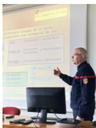
DFCI Meymac 24/03/2023