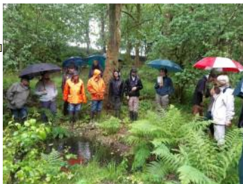
Animation forêt et prise en compte des milieux aquatiques Bonfond—09/06/2023