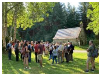
Balade grand public Clédats —23/08/2023 Hydrologie de l'arbre