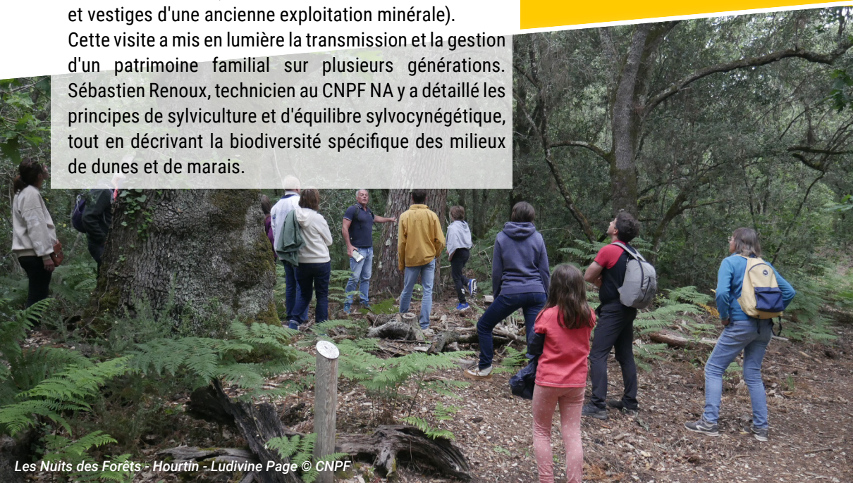
Les Nuits des Forêts - Hourtin - Ludivine Page © CNPF