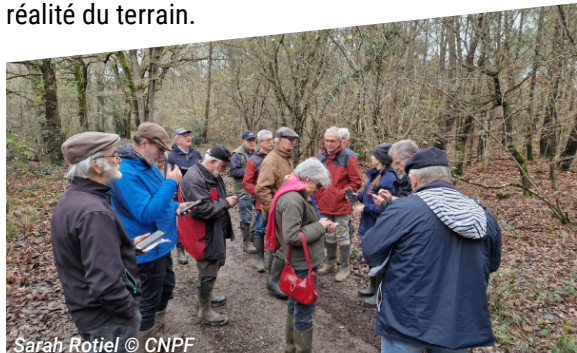
Sarah Rotiel © CNPF

Après-midi sur le terrain : La session s'est poursuivie par une mise en pratique de l'application "Cartes IGN", afin de confronter les données théoriques à la réalité du terrain.