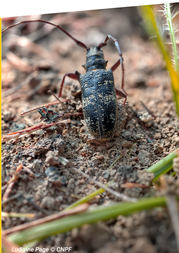
Ludivine Page © CNPF

3. Participation au comité "Nématode" aux côtés de la DRAAF et des partenaires de la filière.