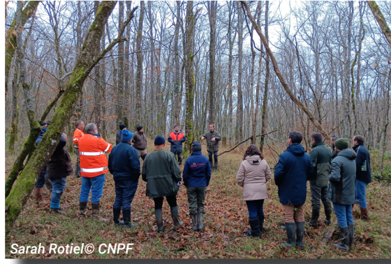
Sarah Rotiel © CNPF

Cette rencontre a permis de confronter les expériences de terrain et de promouvoir une gestion forestière fine et résiliente.