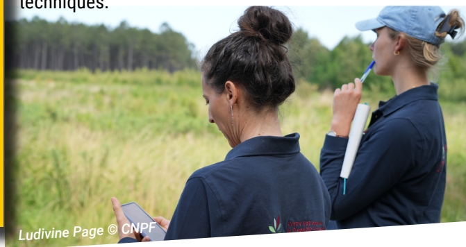
Ludivine Page © CNPF

S upport du conseil aux propriétaires, l'expérimentation a mobilisé 1 115 jours de travail en 2024-2025, soit l'équivalent de 5 postes à temps plein (ETP) . En Nouvelle-Aquitaine, une ingénieure coordonne ce réseau de 1 960 dispositifs , dont 851 essais suivis régulièrement. Un technicien dont le poste est financé par la Région se consacre exclusivement à cette mission. Il s'appuie sur les techniciens et ingénieurs des différents territoires pour les mesures de terrain. Ensemble, ils alimentent la base nationale (ILEX) et diffusent les résultats aux propriétaires forestiers via des réunions de vulgarisation ou des brochures techniques.