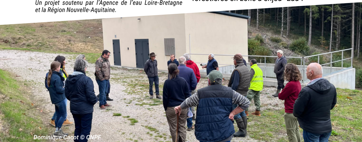
Dominique Cacot © CNPF

Outil pratique : Édition d'une plaquette de référence sur les bonnes pratiques forestières en zone à enjeu "Eau".