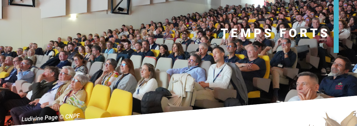
Ludivine Page © CNPF