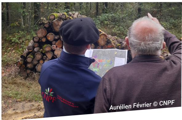
Aurélien Février © CNPF

240 000 € d'aides votées par la Région en 2025 pour 105 dossiers finalisés.