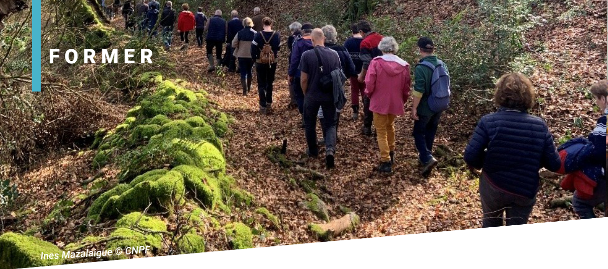
Ines Mazaláigue © CNPF