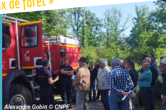
Alexandre Gobin © CNPF

habitat pour limiter les départs de feu. Cette dynamique de proximité transforme la prise de conscience des propriétaires en actions concrètes de mise en sécurité.