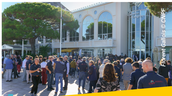
Florent Gallois © CNPF