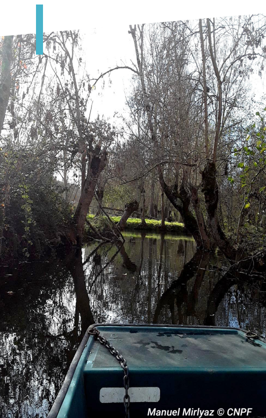
Manuel Mirlyaz © CNPF

U ne expertise de 9 jours menée sur 62 km de circuits de batellerie révèle une fragilité croissante du bocage du Marais poitevin .