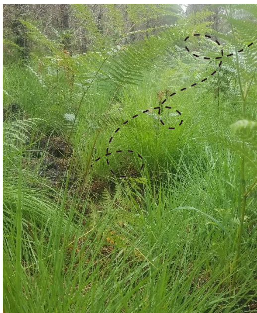
Molinie bleue et fougère aigle dans une parcelle de production de pin maritime